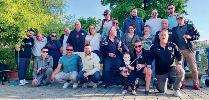
Chargierten-Event FCG, 16. Mai 2025