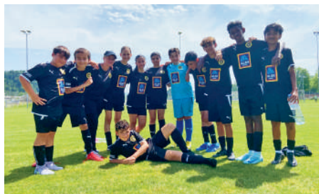
ALDI Suisse neue Teampartnerin unserer Junior:innen E & D.

ALDI Suisse – mit ihrer Filiale Mitten in Gerlafingen zu Hause – mischt neu auch auf dem Kirchacker mit. Gleich zwei Mannschaften wurden mit neuen Trikots ausgestattet: Bei den Junior:innen E und D bringt ALDI als Teampartnerin frischen Wind rein. Motivation genug, um für den nächsten Anpfiff und hoffentlich auch für den nächsten Sieg bereit zu sein. Ein grosses Dankeschön für dieses doppelte Engagement! Wir freuen uns über die Zusammenarbeit und legen den FCaner:innen einen Besuch im Laden ans Herzen.