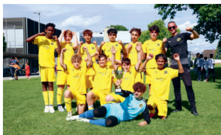
Othmardrive.ch ist jetzt auch auf unseren Trikots unterwegs.

Wir freuen uns auf viele weitere gemeinsame Kilometer auf dem Rasen und darüber hinaus und sagen Danke für das Vertrauen in Gelb-Schwarz!