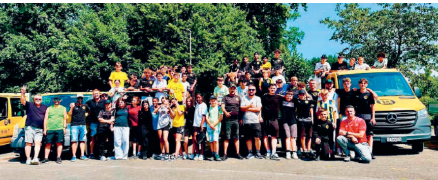
Papsam 2025, 21. Juni 2025