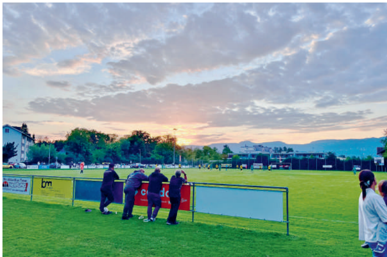
Abenddämmerung auf dem KiAck am Wasserämter-Cup 2025