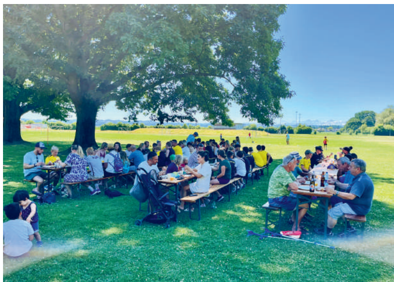
Saisonabschluss 2025 – Feiner Brunch und Spielnachmittag.